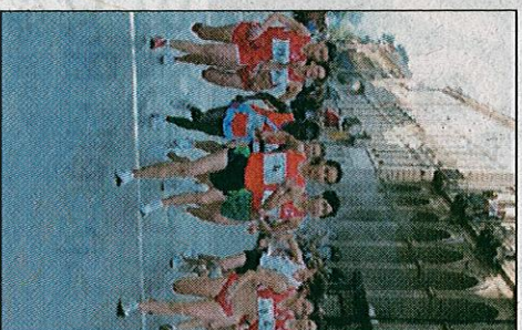
La maratonna pretuziana

Farmacie di turno. Teramo: Cerasani, piazza Martiri della Libertà 34, tel. 0861-248826. Giulianova: Marcelli, piazza Della Libertà 35, tel. 085-8003204. Roseto: Chiccò, via Nazionale 495, tel. 085-8998187. Cinema. Teramo, Comunale. Stagione di Prosa: Cyrano De Bergerac. Smeraldo: The Avengers (3D) (15.15 - 17.45 - 20.15 - 22.45); To Rome with love (15.45 - 18 - 20.15 - 22.30); The Rum diary (15.45 - 18 - 20.15 - 22.30). Giulianova. The Avengers (17.30 - 20.15 - 22.45); To Rome with love (18 - 20.30 - 22.45). Roseto. To Rome with love (18.15 - 20.30 - 22.45); The Avengers 3D (18.30 - 21.15); Bianca-neve (18.20 - 20.30 - 22.40).