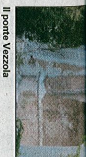
Il ponte Vezzola